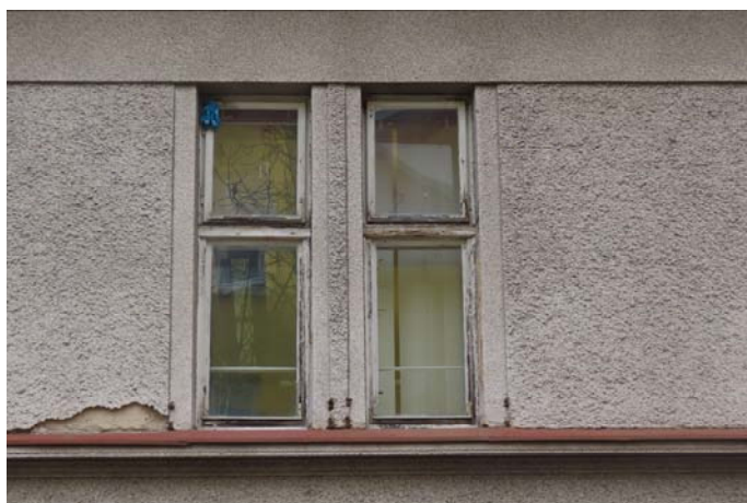
Okna z europrofilů v 1.NP – vyměněná