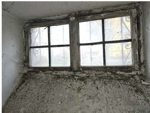
Okna kastlová 1.NP-3.NP - původní